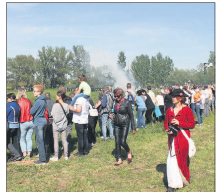
Hunderte Zuschauer verfolgen das Geschehen auf dem Gefechtsfeld - Samstag ab 15 Uhr.