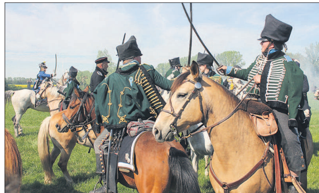
Gefechtsgetümmel hoch zu Roß. Die Zuschauer sind nah am Geschehen dran. Deshalb die Absperrungen nicht überschreiten.