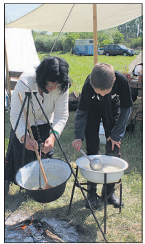
Gekocht wird im Biwak über offenem Feuer.

und Tanz? Richtig, es wäre kein Fest. Und somit erleben die Besucher an allen drei Festtagen ein abwechslungsreiches Rahmenprogramm, was das Scharnhorstkomitee Großgörschen e.V. auf dieser Seite mit dem dazugehörigen Zeiten veröffentlichten lässt.