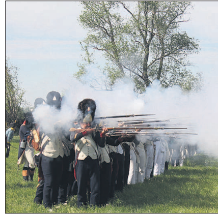
„Feuer frei“ – und schon ist das Gefechtsfeld völlig vernebelt, ebenso bei den Kanonenschüssen.

historische Gefechtsdarstellung auf einem Teil des Original-Gefechtsfeldes am Samstag ab 15 Uhr.